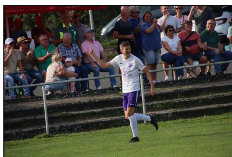
JP und jubelnde Fans

Mit dem 6:1 Sieg über Großalmerode fand das Vereinswochenende einen tollen Abschluss. Vorher konnten sowohl die Zweite und auch die AH siegen. Besondere Erwähnung muss aber die grandiose Aufholjagd unserer C-Jugend finden, die das Spiel zu ihren Gunsten drehen konnte. Wir möchten uns auch auf diesem Weg herzlich bei allen Helfern bedanken, ohne Euch wäre dieses Vereinswochenende nicht so ein Erfolg geworden. VIELEN DANK!!!