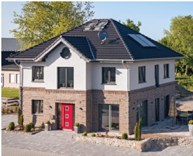
Firmensitz in Madfeld Lichthaus 152 als Stadtvilla

Telefon: 0 56 03 / 9 16 98 49 Telefax: 0 56 03 / 9 16 98 46 Mobil: 01 63 / 9 82 76 00