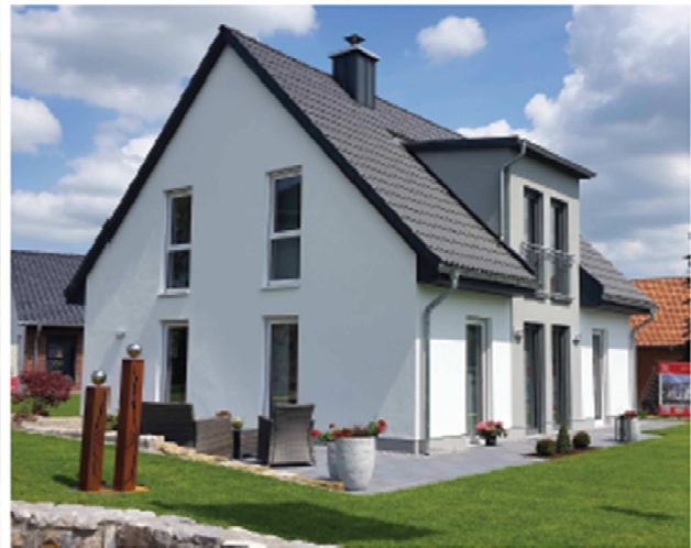
Musterhaus in Madfeld Flair 125